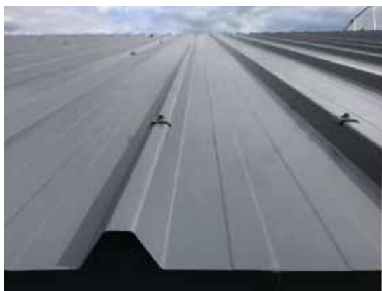
Ondatherm® T 100 mm Parement extérieur : Hairplus® Abyss

* Limité à 6 mètres dans le cadre du DTA