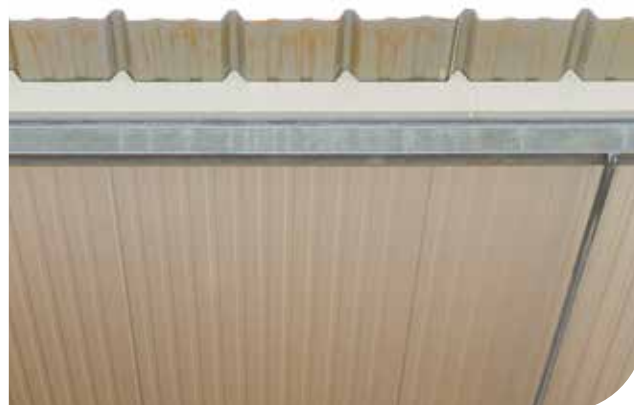
Ondatherm® T 100 mm Parement intérieur : Intérieur White