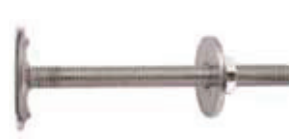
WD/P 10 - Fixation de chauffe-eau (avec grandes rondelles)