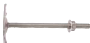
WD/P 6 - Fixation de radiateurs