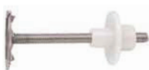
WD/P 8 - Fixation pour lavabos au travers de parois minces